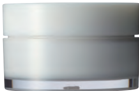
AE-30J (インジェクション・インサート成形) H36.0×ø58.0mm 30g in:白, out:ナチュラル