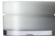
AE-10J (インジェクション・インサート成形) H28.5×ø46.5mm 10g in:白, out:ナチュラル